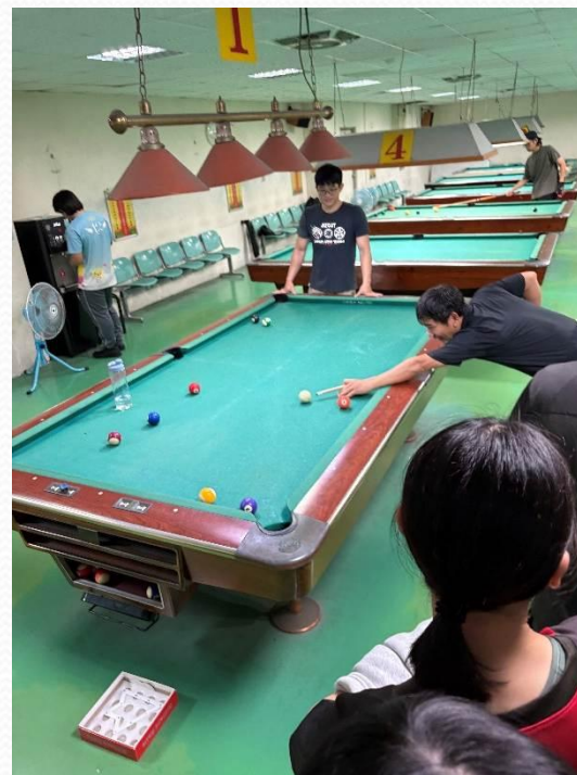
運動休閒系－攀岩與撞球體驗