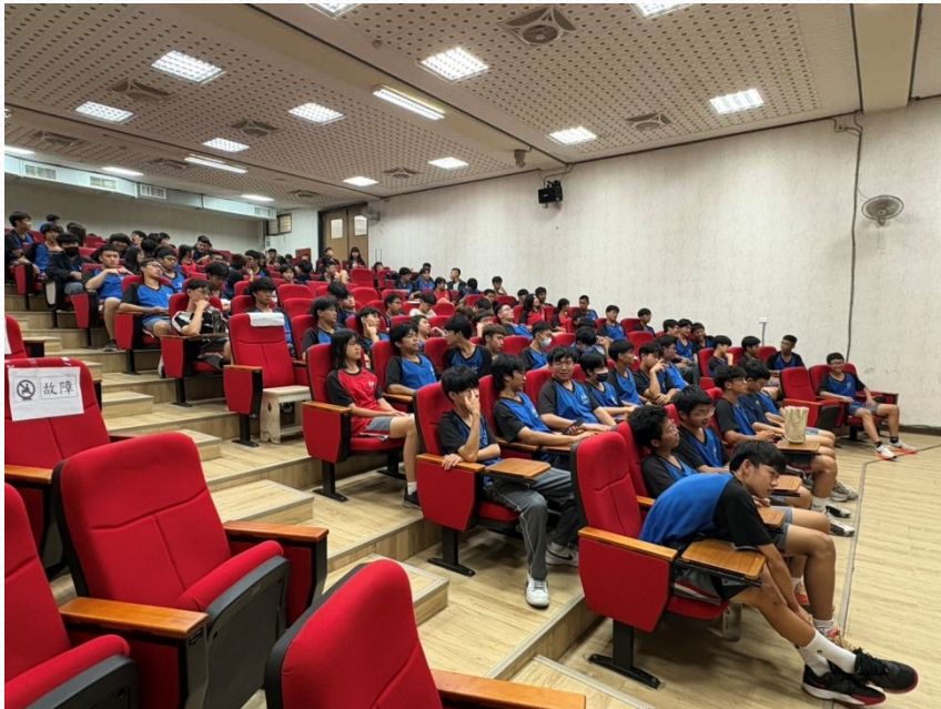
學生認真聆聽講座