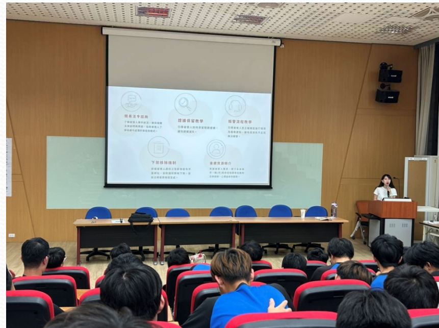
講師談及在關係中遇到疑似恐怖情人時的自保之道、可尋求協助的資源