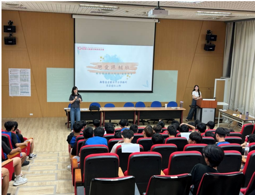
輔導主任開場及介紹講師